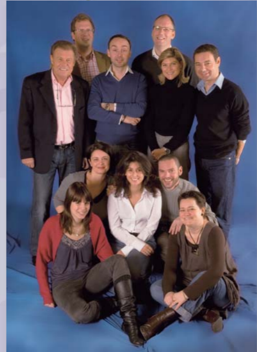
Equipe de Lonay

L'équipe de la Fondation Théodora a souhaité clore l'année en feuilletant l'album des quinze années écoulées.