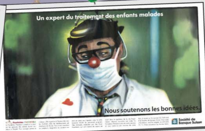
Un expert du traitement des enfants malades Nous soutenons les bonnes idées. En optant pour un financement basé sur le sponsoring social avec l'arrivée en 1994 d'EIM, premier partenaire-mécène, la Fondation a su s'imposer comme un précurseur dans le domaine de la récolte de fonds. En 2008, la Fondation peut compter sur le soutien de 13 entreprises-partenaires.