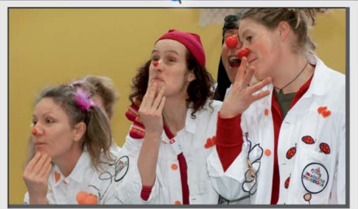
Pour devenir docteur Rêves, les artistes de la Fondation suivent une formation pointue auprès de «La Source», Haute école de la santé basée à Lausanne. L'encadrement des artistes est assuré par du personnel médical reconnu et issu de différentes disciplines.