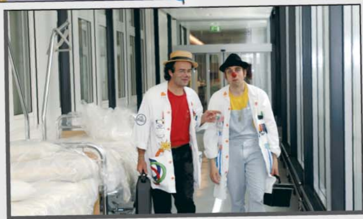
Il y a 15 ans, la Fondation démarrait les visites à l'hôpital avec deux docteurs Rêves. Elle compte aujourd'hui 42 docteurs Rêves et assure la formation de 12 nouveaux artistes.