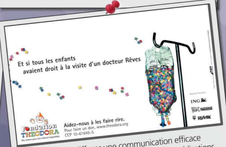
Dans le souci de diffuser une communication efficace et à frais réduits, les espaces publicitaires et les publications sont entièrement offerts ou financés par des entreprises-partenaires.