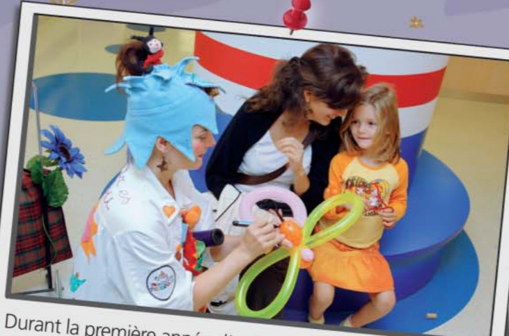
Durant la première année d'activité de la Fondation, les docteurs Rêves ont rendu visite à 1'750 enfants. En 2008, quelques 65'000 enfants ont reçu la visite d'un docteur Rêves.