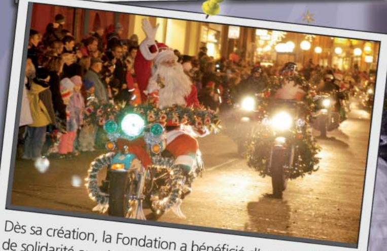
Dès sa création, la Fondation a bénéficié d'un grand élan de solidarité auprès du public. Les événements, mis sur pieds par des privés ou des entreprises, se sont multipliés ces dernières années. Leur réalisation est rendue possible grâce à l'intervention fidèle et efficace d'une septantaine de bénévoles.