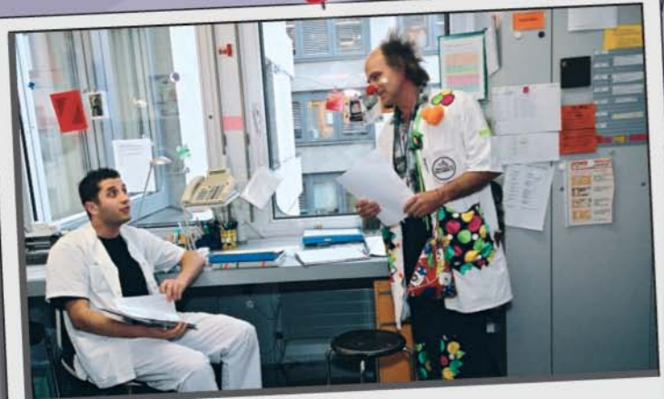
En 1993, le CHUV accueillait les premiers docteurs Rêves. En 2008, notre présence s'est étendue à 36 hôpitaux et 10 institutions spécialisées en Suisse. La Fondation entretient une collaboration étroite et précieuse avec le personnel soignant et les médecins, sans qui les visites des docteurs Rêves ne pourraient avoir lieu.