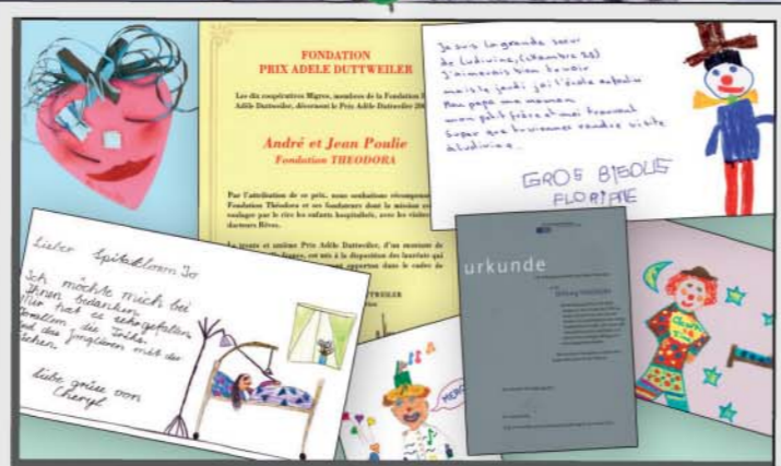
En tant qu'institution reconnue d'utilité publique, la Fondation permet aux donateurs de bénéficier d'une exonération fiscale sur leurs dons. Mais la véritable reconnaissance de la Fondation tient à d'autres éléments: les témoignages des parents, les dessins d'enfants et les prix qui récompensent son action («Prix Duttweiler 2006» et «Prix Doron 2007»).