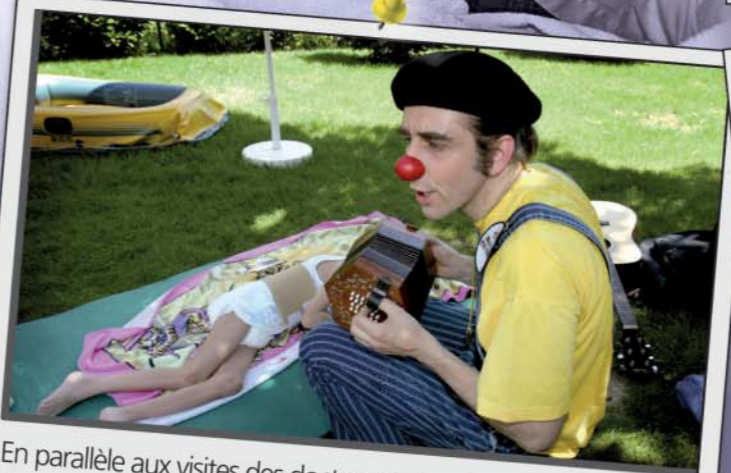
En parallèle aux visites des docteurs Rêves, la Fondation a initié deux nouveaux programmes: «Monsieur et Madame Rêves», destiné aux enfants en institutions spécialisées et «Les docteurs Rêves en pique-nique», une approche interactive de la nutrition. Les artistes reçoivent une formation spécifique pour chacun de ces programmes.