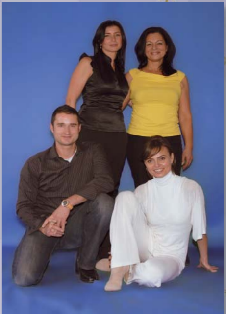
Equipe de Hunzenschwil

L'occasion pour nous de jeter un regard en arrière et d'en extraire quelques clichés, comme autant d'étapes importantes que nous avons franchies grâce à votre soutien, à celui des bénévoles, du personnel soignant et de nos partenaires.