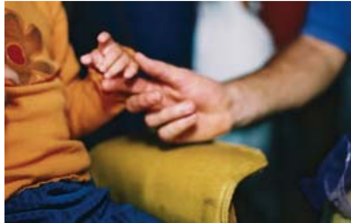
Un instant de complicité avec Monsieur Rêves

«Chez nous, après la visite de Monsieur Sparadrap, il se passe parfois des choses totalement imprévisibles. Ne serait-ce que par le simple fait qu'il est un homme et qu'au sein de nos institutions, les enfants sont très entourés de femmes. La présence d'un ami homme est pour eux essentielle. Nous tenons à saluer ici la démarche de la Fondation qui a pu et su rendre possible ces visites d'un type nouveau pour nous tous.»