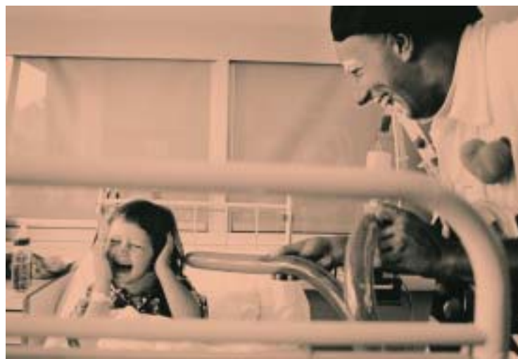
Docteur Toc-Toc à l'hôpital de l'enfance, Lausanne

Avec des mots très justes, il m'a extrêmement bien résumé la situation et m'a permis de mieux comprendre une des réalités des docteurs Rêves. Il m'a dit: «Tu as simplement donné une vie, une histoire à cet enfant qui était tant attendu par sa famille, peut-être ses frères et sœurs, ses futurs