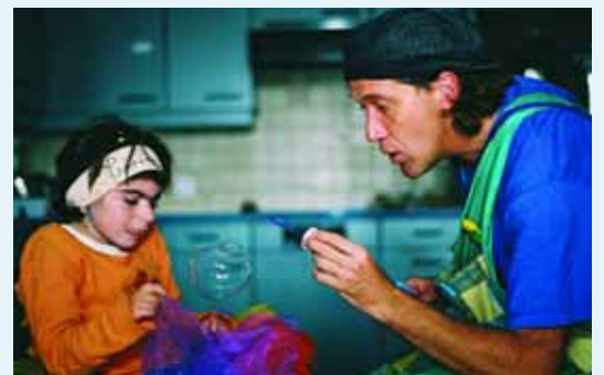
Monsieur Sparadrap au foyer Clair Bois, Lancy

Les enfants polyhandicapés sont à la fois proches et très éloignés. Ils appartiennent à notre monde et au leur. A nous de le pénétrer. Poursuivant un long chemin, la Fondation Théodora a noué, voici longtemps déjà, une collaboration avec quelques organismes spécialisés: Les foyers Clair Bois de Lancy et Chambésy dans le canton de Genève, le Centre de Développement et de Neuro-réhabilitation à Bienne... Très encourageante, l'expérience nourrit un nouveau rêve. Atteindre le plus grand nombre possible d'enfants placés en institution, afin de briser la monotonie du quotidien par des intermèdes attendus, par des instants remplis de rires, d'amusement et empreints de confiance.