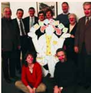
Une joyeuse équipe de Lions

Les Lions et leurs épouses se sont rassemblés pour vendre de délicieuses flûtes aux épices, des oranges confites et le traditionnel vin chaud lors du marché de Noël à Lutry. Cette sympathique idée a permis de verser la coquette somme de CHF 2'000.- à la fondation.