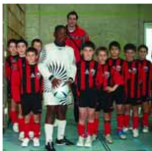
1 er FC NE Xamax

Streetconcept a organisé le 28 janvier la «Théodora's Cup», un tournoi de football en salle réunissant dix équipes de jeunes talents de 10 à 12 ans au profit d'une bonne cause. A la fin de la journée, notre désormais célèbre équipe de docteurs Rêves «Lokomotiv nez rouge» a été confrontée à l'équipe «Dream Team» composée de personnalités connues du ballon rond.