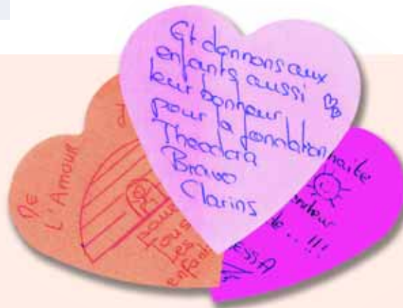
Témoignage récolté durant l'action Clarins et Marionnaud

De septembre à décembre 2005, Clarins et Marionnaud se sont associés à l'occasion des fêtes de Noël pour offrir du bonheur aux enfants hospitalisés. Cette action aura permis de récolter près de CHF 31'000.-. Elle aura aussi inspiré de nombreuses personnes à laisser de superbes messages en forme de cœur. Le cœur source de vie qui bat plus ou moins vite en fonction de nos émotions, nos passions. C'est aussi avec passion que nous œuvrons tous afin que les docteurs Rêves apportent un peu de réconfort aux petits patients.