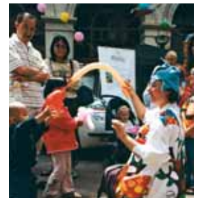
A la découverte d'un ballon magique...

Morges, 4 juin. A l'initiative de l'Association des Commerçants, grande fête des clowns, rue de Savoie. Nos docteurs Rêves Didou, Kiko, Lupo et Klein sont du nombre. Ils ne manquent pas d'apporter leurs soins éclairés à une jeune assistance en mal d'amusements, mais non d'applaudissements.