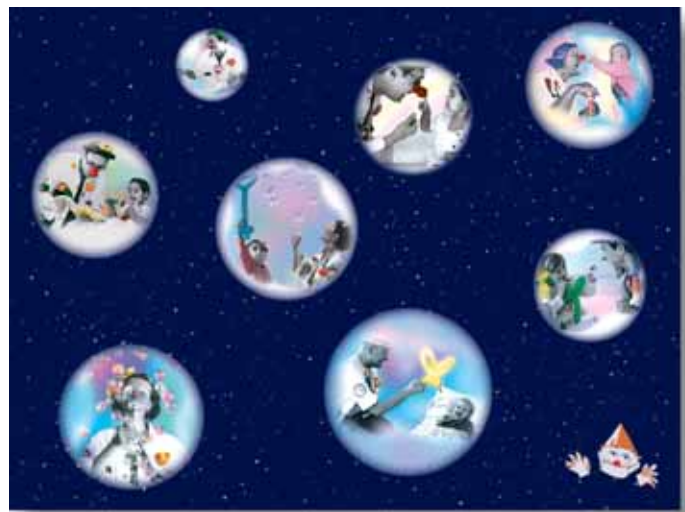
FT05-11 Magali Koenig / Raphaël Raisin