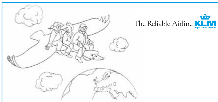
«Boarding Pass» distribués à l'aéroport de Genève et Zurich. Illustration Léonard Steck.

Il y a neuf ans, KLM jouait déjà un rôle important dans le développement de la Fondation Théodora. En effet, la compagnie néerlandaise lui permit de parcourir gracieusement le globe afin de créer et de développer des programmes de clowns d'hôpitaux dans des pays où il y en avait grand besoin. C'est ainsi que sont nés les programmes de docteurs Rêves de la Fondation Théodora en Afrique du Sud, en Chine et en Biélorussie, programmes actifs aujourd'hui encore.