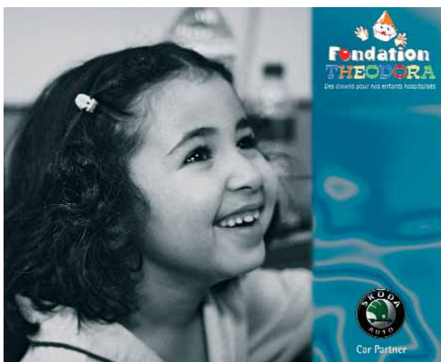
Affiche réalisée pour le salon de l'automobile 2004 à Genève pour le stand Skoda

pour son humour et sa créativité, en présence d'un public nombreux. Dorénavant, sur nos routes, ouvrez l'œil, vous pourriez croiser les sympathiques Skoda de la Fondation.