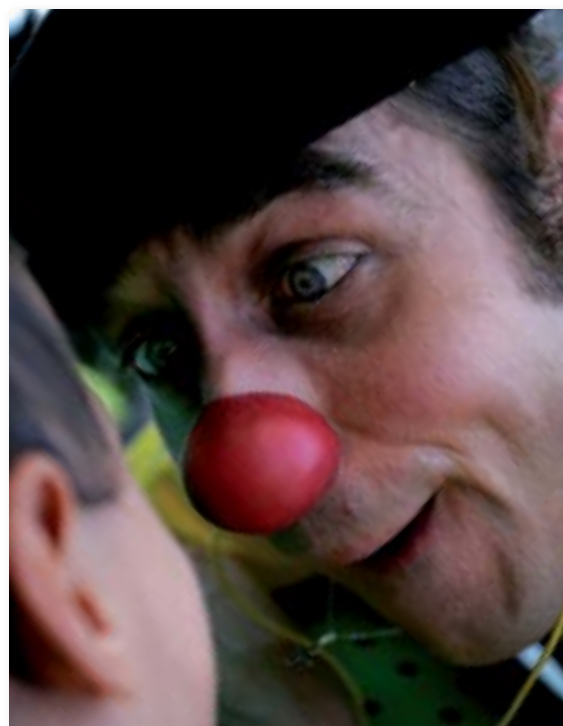
Moment de complicité