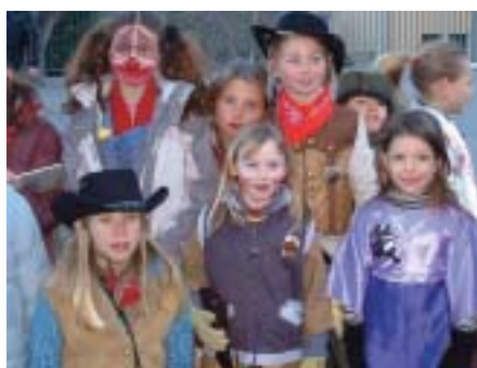
Une participation complète

Afin de familiariser cette jeunesse avec la mission de Théodora, une présentation a été donnée par un Ambassadeur bénévole de la Fondation. A l'issue de ces performances, une collecte s'est tenue en faveur de Théodora.