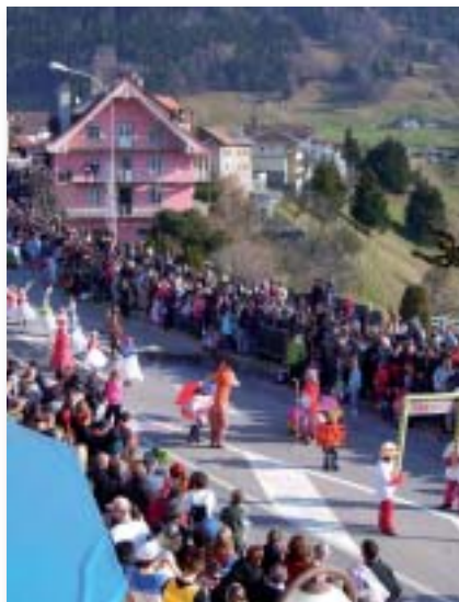
Cortège avec de la musique guggen