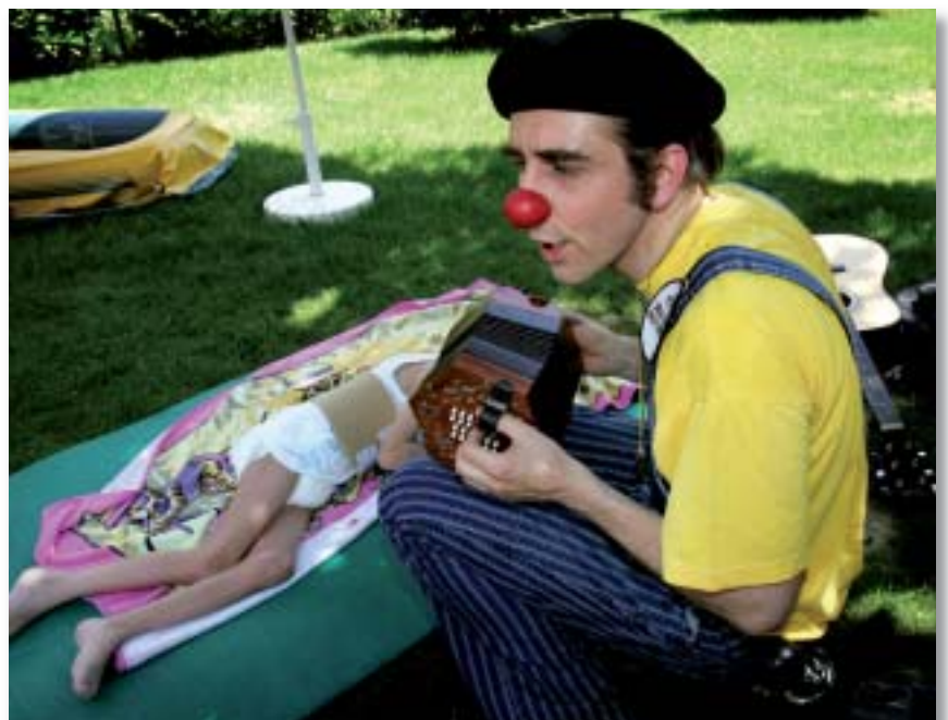
Méloдие sur l'herbe

Parfois je fais mouche, alors, content de moi, j'aboie comme un petit chien et Antoine rigole. Il est assez fréquent qu'il soit pris par une crise, qu'il «décroche» et que son regard se perde dans le lointain. Alors le petit chien se met à aboyer pour rappeler son maître et doucement Antoine revient à lui.