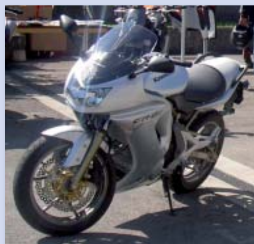
En route pour l'aventure !

En vous amusant, vous offrirez également des sourires et éclats de rire aux enfants séjournant à l'hôpital de Pourtalès de Neuchâtel. Toute la somme récoltée par le «moto club le Cressiquois» durant la manifestation sera attribuée intégralement à la Fondation Théodora !