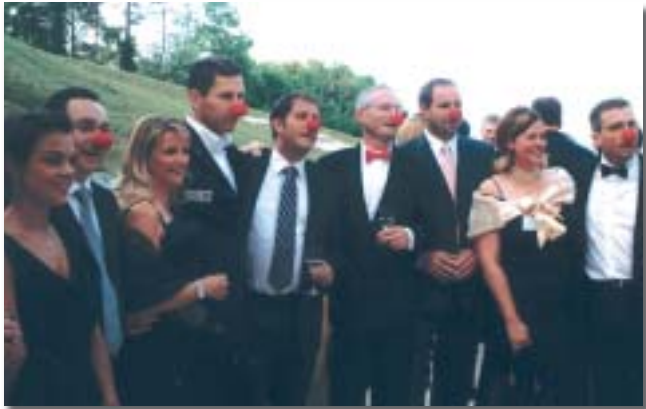
Les chevaliers au nez rouge

Environ 550 tablers de 37 Tables Rondes, réparties sur l'ensemble du territoire helvétique, vont donc se mobiliser durant toute une année pour faire connaître ou rappeler à la population suisse, l'importance des docteurs Rêves pour les enfants hospitalisés.