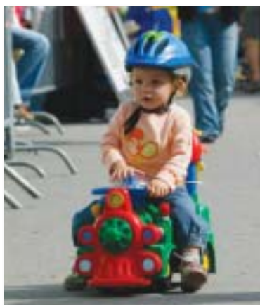
L'important, n'est-il pas de participer!

Les 14 et 15 septembre prochains, enfants, familles, populaires et compétiteurs s'élanceront sur la 18 ème édition de l'Open Bike Haute-Gruyère; il y aura un parcours pour chacun. Un cornet surprise sera distribué à chaque enfant jusqu'à 5 ans et même si l'un d'eux aurait oublié son vélo, un cadeau l'attendra au stand info. Grandvillard sera sous haute animation comme par exemple grimage, tours de poneys et un fantastique concours proposé sur le stand de la Fondation Théodora présente sur l'Open Bike. La cantine titillera toutes les papilles gustatives et l'hélicoptère emmènera enfants et parents pour un vol panoramique gruyérien et de la course (prix spécial Open Bike ou vols HéliSwiss à gagner). Renseignements et/ ou inscription online: www.openbike.ch .