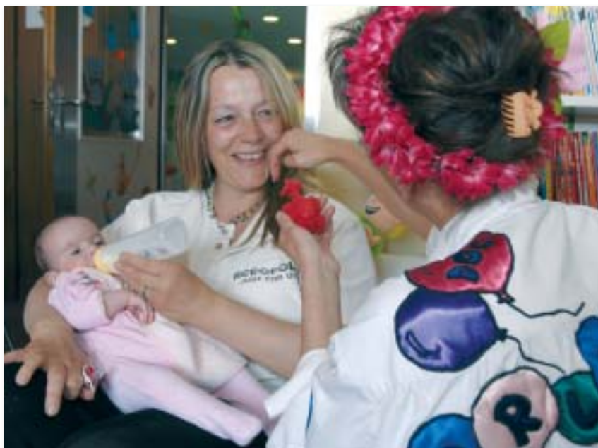
Sourire et tendresse pour les petits et les grands

Mon parcours en quelques mots: infirmière en pédiatrie pendant de nombreuses années. Je me suis engagée auprès de la Fondation Théodora dès 1995 et pendant plusieurs années de manière régulière et hebdomadaire dans les hôpitaux de Fribourg, Payerne et Yverdon. Cela fait maintenant 6 ans que j'officie en qualité de remplaçante pour tous les hôpitaux de Suisse romande.