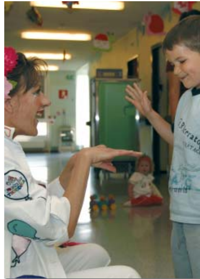
Il y a les rires mais aussi les jeux

* L'ordonnance d'un docteur Rêves est en fait une carte postale couleur le représentant avec tous ses accessoires de clown docteur.