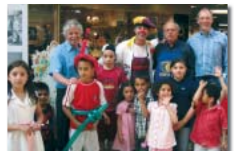
Une équipe pleine d'enthousiasme

Pendant la journée du 28 avril, merci au Kiwanis Club de Genève qui s'est mobilisé dans les deux centres commerciaux de Balexert et de La Praille, pour vendre des nez rouges au profit de la Fondation et de l'association Armel.