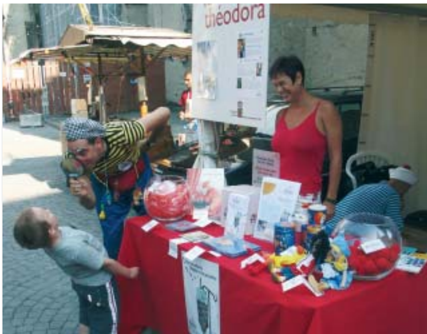
Stand de la Fondation Théodora - Festival de la Cité à Lausanne - 2006

Cette année, grâce au partenariat avec Nestlé, nous serons à nouveau associés au Festival de la Cité. Comme lors de l'édition précédente, les docteurs Rêves et le Professeur Nutrus organiseront des Pique-niques pour les jeunes spectateurs. L'objectif de ceux-ci étant de transmettre aux enfants, de manière ludique, des règles de comportement alimentaire et de favoriser une meilleure prise de conscience de l'importance que représente, sur le plan de la santé, une alimentation équilibrée.