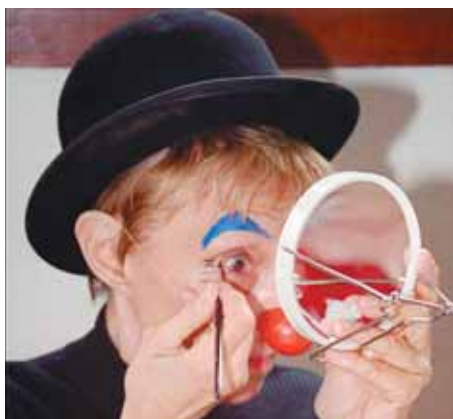
La recherche de son maquillage, un travail très individuel

parties. La première consiste en la sélection et la formation de nouveaux docteurs Rêves et la seconde concerne la formation continue des artistes nommés et mandatés officiellement par la Fondation.