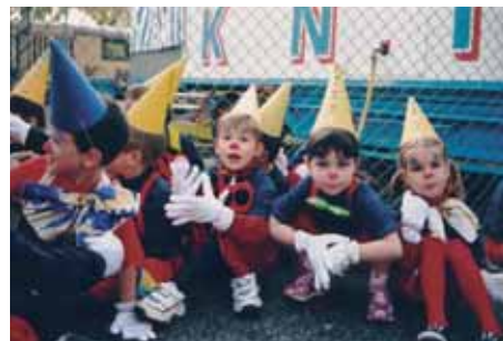
La chorale du Collège Champittet

Dans le courant de l'après-midi, 230 personnes, des enfants et leurs familles invités par les docteurs Rêves pendant leurs visites à l'hôpital, ont dégusté un goûter devant le chapiteau et visité le zoo en compagnie de docteurs Rêves.