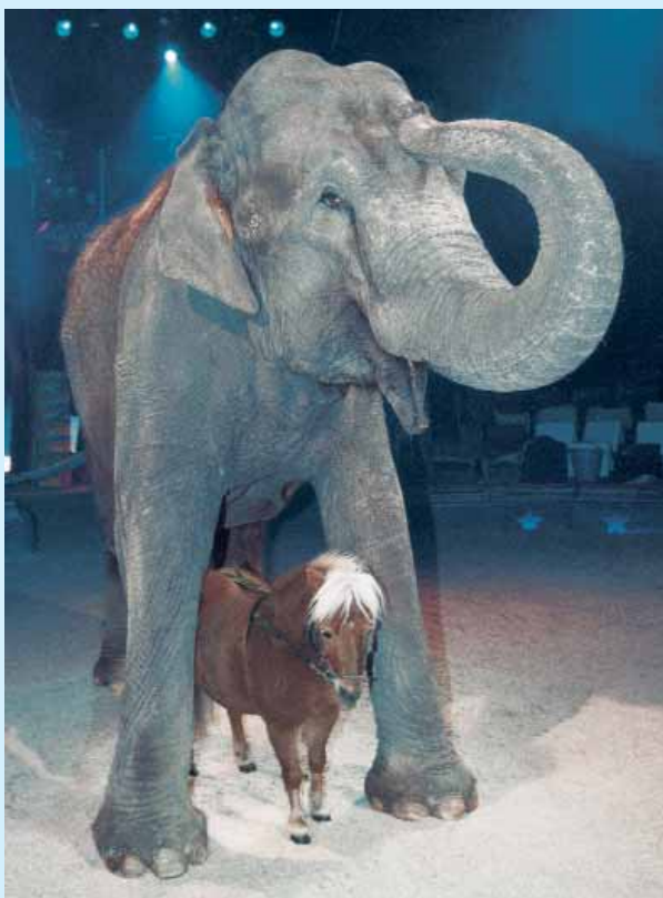
Un éléphant d'Asie et le poney «Hollywood»

Cette grande fête en faveur des enfants hospitalisés a permis de saluer les résultats atteints grâce au soutien généreux de nombreuses personnes, fondations et entreprises au premier rang desquelles se trouve le collège Champittet, partenaire principal de la soirée.