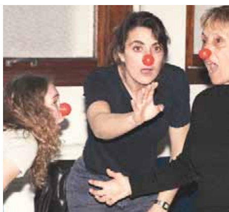
A la découverte du clown...

parties. La première consiste en la sélection et la formation de nouveaux docteurs Rêves et la seconde concerne la formation continue des artistes nommés et mandatés officiellement par la Fondation.