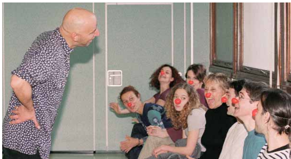
Un atelier d'expressions clownesques

Afin de poursuivre ses objectifs de qualité et de développement, la Fondation Théodora a créé une structure de formation spécifique à ses besoins. Elle en assume l'entière responsabilité mais collabore avec des partenaires-formation reconnus et particulièrement appréciés des milieux médicaux. La Source, Ecole romande de soins infirmiers de la Croix-Rouge suisse est l'institut avec lequel la Fondation Théodora, en Suisse, collabore très étroitement. Le module de formation développé est divisé en deux