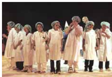
La chorale en piste

Dans le courant de l'après-midi, 230 personnes, des enfants et leurs familles invités par les docteurs Rêves pendant leurs visites à l'hôpital, ont dégusté un goûter devant le chapiteau et visité le zoo en compagnie de docteurs Rêves.